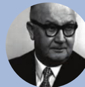
Generalkonsul Frode Hedorf 1891 – 1961